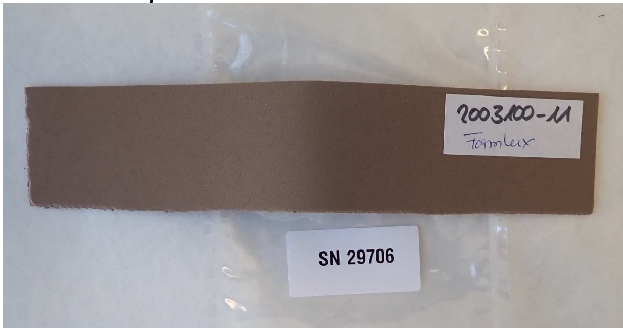
Abbildung 2 / Figure 2: Material Formlux