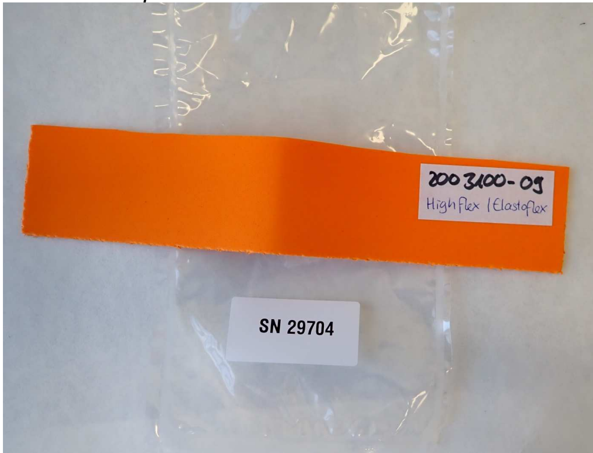
Abbildung 2 / Figure 2 : Material Highflex/Elastoflex